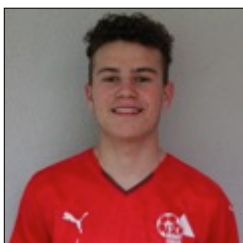
25 Nico Federer 1998 - Verteidigung