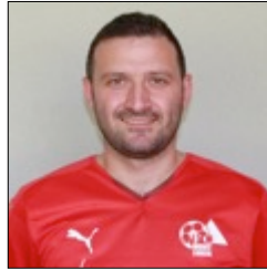
10 Murat Demirtas