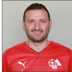
10 Murat Demirtas