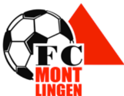
17 Suat Osmani 1997 - Stürmer