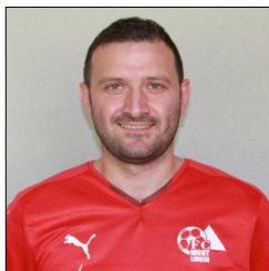
10 Murat Demirtas