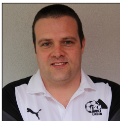
TR Celli Lüchinger Trainer